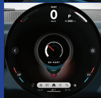
Unidad interactiva MINI. Pantalla central OLED con un área de 440 cm 2 .