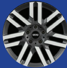
17" Parallel Spoke || 2-tone Spectre Grey Dark Metallic.