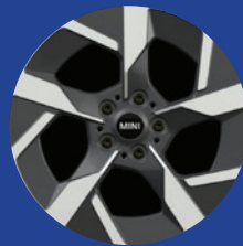
18" Slide Spoke || 2-tone Jet Black.