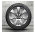
Rin 17" Imprint Spoke